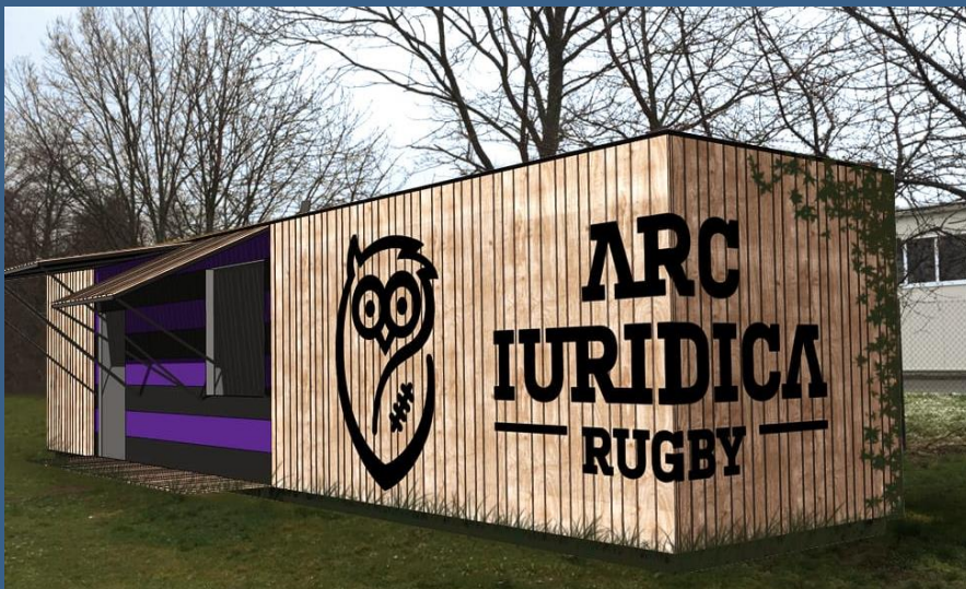
Takto budou vypadat extra prostory pro zázemí po dokončení. Návrh je od firmy Labor13.